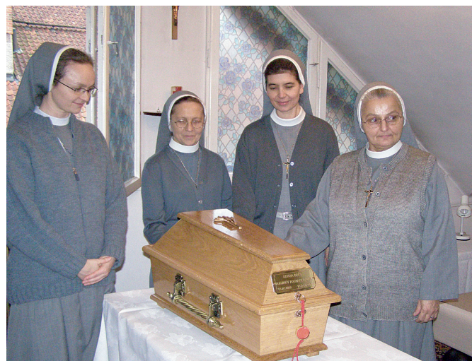
Siostry przy zapieczętowanej trumnie z doczesnymi szczątkami Sługi Bożego ks. Ignacego Posadzego

Umiera 17 stycznia 1984 roku, w opinii świętości.